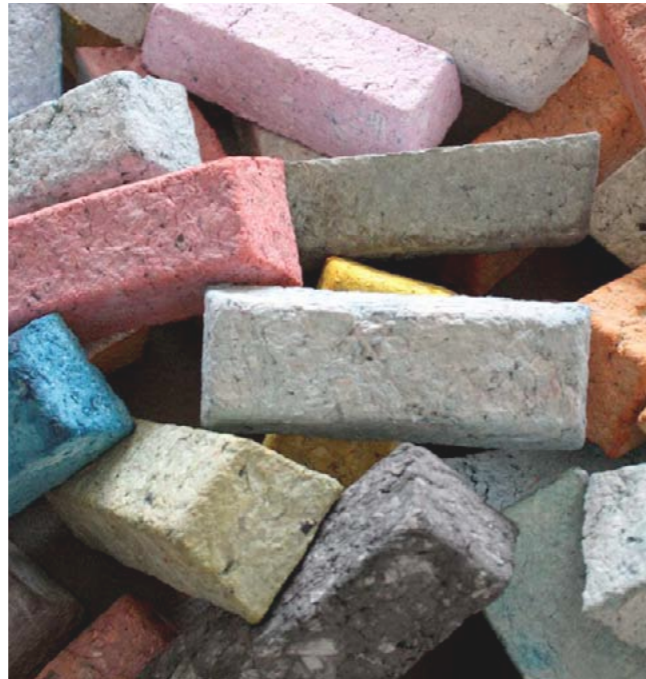
A destra: lorem ipsum dolor sit amet, consectetur adipiscing elit, sed do eiusmod tempor incididunt ut labore et dolore magna aliqua.